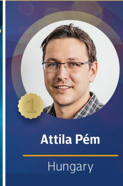
Pém Attila Várásliget Zrt./Castellum

2023. évi IPMA nemzetközi Projektmenedzser Díj győztese