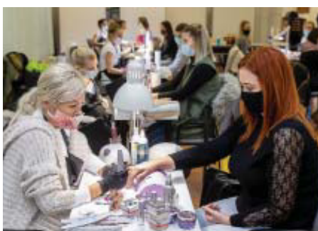
Kézápoló és körömkozmetikus mesterek vizsgája decemberben a kamara színházában

entációs szakaszban elkezdődik. Az első pilot képzés keretében a Dunaújvárosi Kamaránál 12 fő kézápoló és körömkozmetikus mester felkészítésére és vizsgáztatására került sor 2020. augusztus 28. és december 9. között. Az új követelményrendszernek megfelelő program az elméleti és gyakorlati tartalom tanulási eredmény alapú elsajátítása mellett pedagógiai tréninggel, valamint portfólió készítéssel és informatikai prezentációval egészült ki. A mesterlevelek átadására a veszélyhelyzet elmúltát követően, a jövő év elején kerülnek sorra.