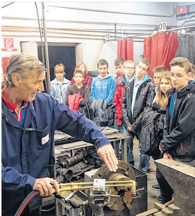
Látogatás a Dunaferri tanműhelyében: új távlatok nyílnak így

A pályaaorientációs tanácsadói hálózatot 2012 végén hozták létre a kereskedelmi és iparkamaráknál. Az országos hálózat működése a területi kamarák pályaaorientációs tanácsadóira épül, akik tevékenységét központi kiadványok, weboldalak, képzések, programok és felmérések segítik. A Magyar Kereskedelmi és Iparkamara gazdasági lapja, az Üzleti 7 épp a közelmúltban jelentkezett egy pályaaorientáció különszámmal. A tartalmas, a működés hátterét, az egyes területi tapasztalatokat összegző kiadvány az