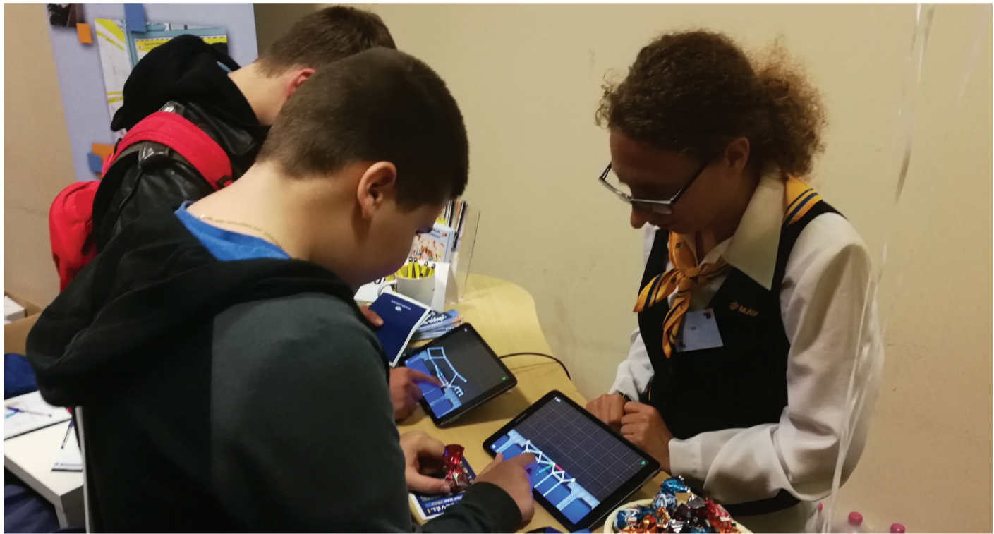
Izgalmas feladatokat kellett megoldaniuk a MÁV nyílt napra látogatóknak

A dunaujvárosi 7-8-os tanulók, gimnazisták, szakközépiskolások nagy többsége élvezettel vetette bele magát az egyes standok kínálatába, feladataiba, gyűjtötte a pecsétet a „menetlelve”. A gimnaziumi csapattal az éppen itt vendégeskedő német diákok is